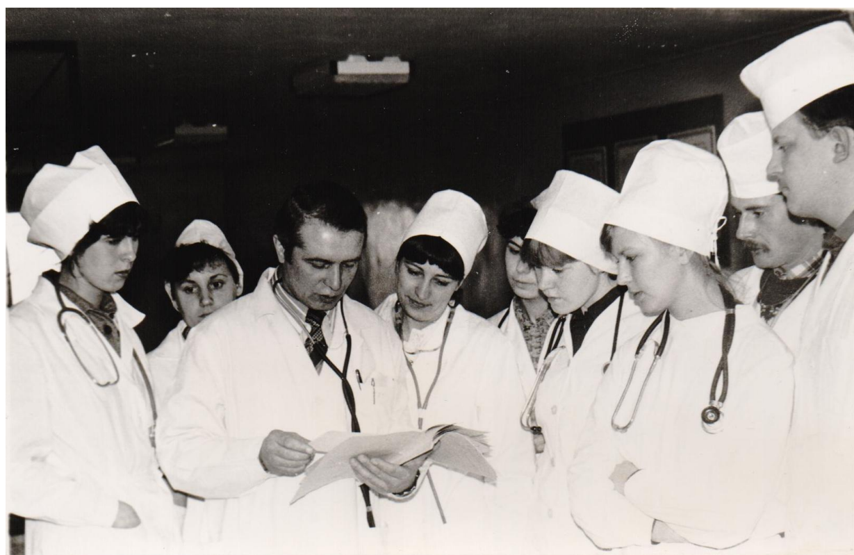
Занятия со студентами IV курса лечебного факультета (1985)