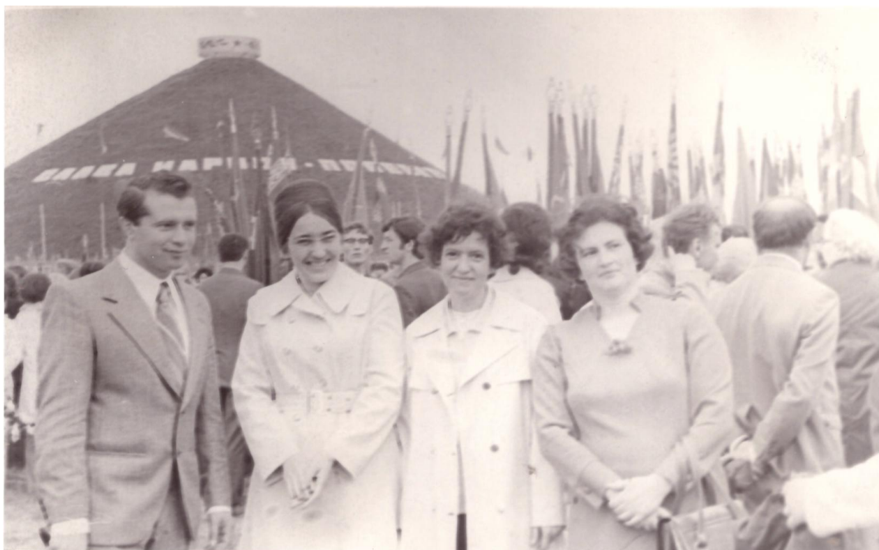
Первомайская демонстрация (1974)