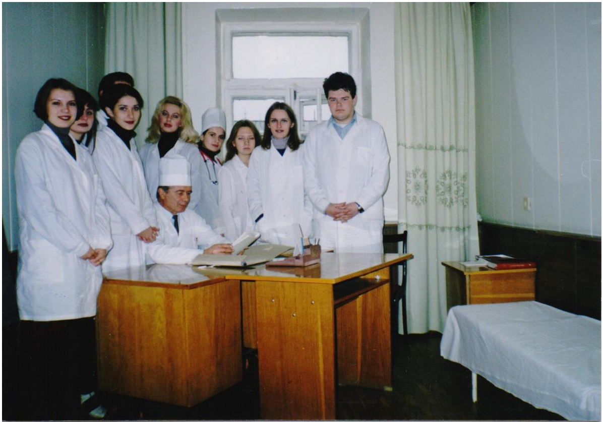
Занятия со студентами IV курса педиатрического факультета (2001)